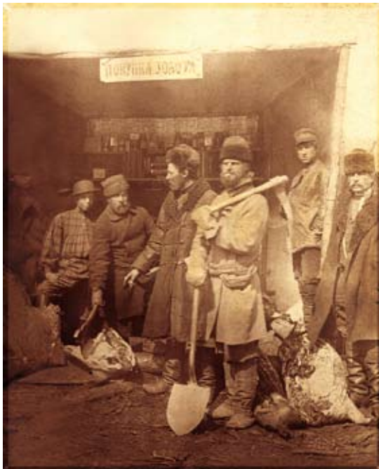
Старатели у пункта скупки золота