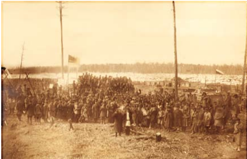
Сход на Орловом Поле