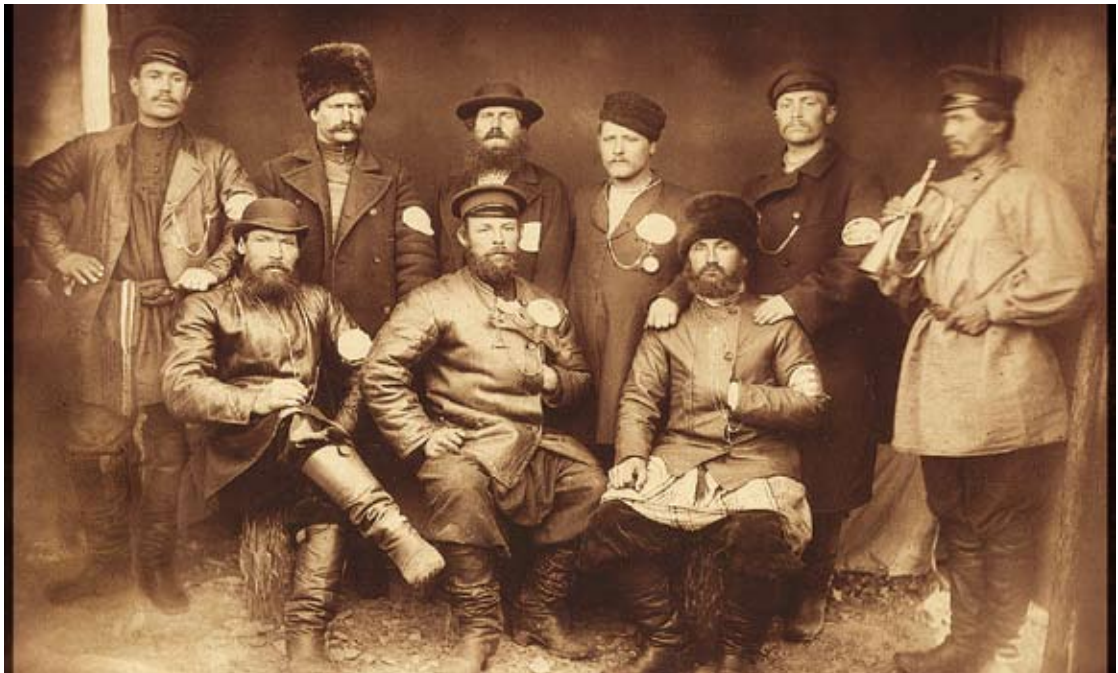
Выборные старосты четырех русских округов поселка и горнист