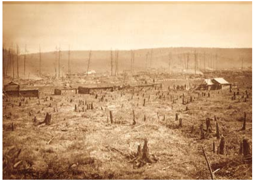
В долине Желтуги

Большинство жителей Желтуги селились и строились по обеим сторонам большой и широкой улицы, названной Миллионной. Жили они в непрезентабельных зимовьях – простых срубках из бревен с узкими окнами и небольшими дверями. Для сохранения тепла срубы конопатили мхом. Крыши, преимущественно плоские, служившие также и потолком, клали из массивных бревен, покрывали дерном, засыпали достаточным