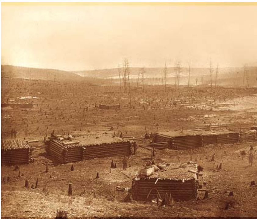
Дома жителей поселка

слоем земли. Полы были земляные, реже из бревен, слегка стесанных с верхней стороны. Для отопления зимой использовали глинобитные или железные печки. Такую избу шириной и длиной в 4 сажени и высотой 3 аршина (8.5×8.5 м и высотой 2.13 м. – Прим. авторов ) желтугинские плотники ставили в очень короткие сроки и брали за нее 200 рублей [Амурская ..., 1886, с. 144-145].