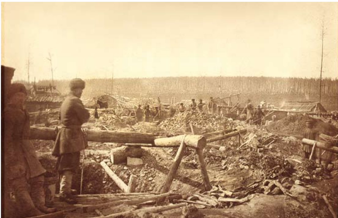
«Хищническая» отработка россыпи. Отвалы пустой породы между старательскими шурфами